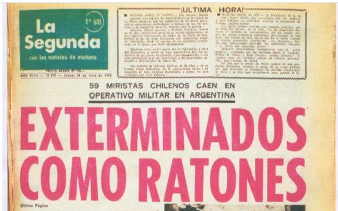
Imagen 3: Titular diario La Segunda 24 de julio de 1975.

Al día siguiente, día 24 de julio de 1975, el diario “La Segunda”, en su portada, publica uno de los titulares más escalofriantes y despiadados de la historia de la prensa chilena: “Exterminados como ratones: 59 Miristas chilenos caen en operativo militar en Argentina”. La noticia, señala bajo el titular “Exterminan como ratas a miristas” que en el operativo antiguerrillas realizado por fuerzas policiales argentinas en la localidad de Salta se habrían identificado a 59 “extremistas” chilenos en distinto estado (muertos, heridos y evadidos). Se señala también que los 59 “extremistas” chilenos pertenecen al MIR que operaban en la localidad argentina con conexiones en Chile, Bolivia y Uruguay. A continuación, se señala la lista de las cincuenta y nueve personas muertas en el supuesto enfrentamiento. La información entregada por el diario “La Segunda” tenía como única fuente la publicación del diario brasileño “O’Dia”.